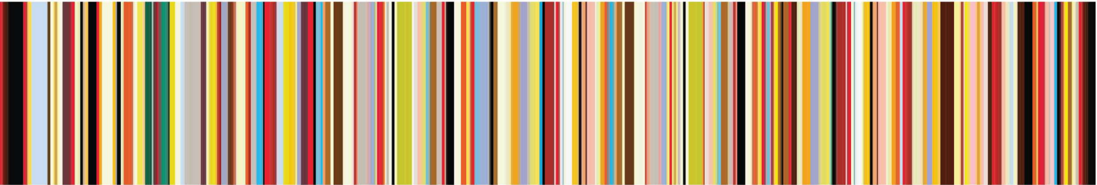
Versione HOH! TRIO SMART